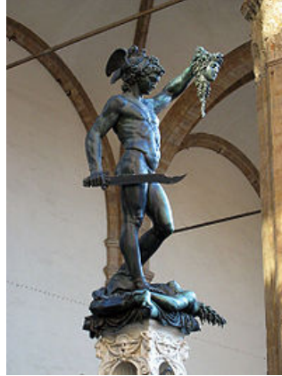
Perseus chém đầu Medusa

* Ấn-độ thường được gọi là đất của rắn. Rắn được thờ như thần. Hiện nay vẫn còn hình ảnh đàn bà Ấn-độ đổ sữa vào bình mang dạng rắn. Rắn hổ mang được thấy mang trên cò trong hình Shiva và Vishnu ngủ trên rắn có 7 đầu với con rắn cuộn tròn. Nhiều điện đài ở Ấn-độ chỉ thờ rắn hổ mang, mệnh danh là Nagraj . Họ tin rằng rắn mang lại trù phú. Hàng năm cũng có một ngày lễ Ấn-độ gọi là Nag Panchami để vinh danh rắn.