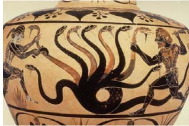
Hercules và rắn Hydra 9 đầu